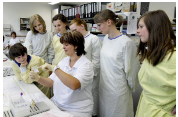
Großer Andrang beim Zukunftstag 2012 in der Uni-Blutbank.