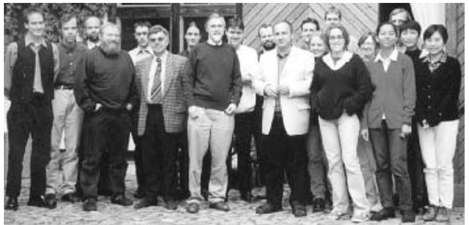
Symposium im September 2000 im Kunsthof Augustusgabe in Barby

eine Diplom-Statistikerin, genauso wie Medizinstudenten unserer Fakultät, die nach den Richtlinien der DFG bei herausragenden Leistungen schon während des Studiums gefördert werden können. Im Besonderen ergriffen 3 bis 5 Medizinstudenten pro Förderperiode die Möglichkeit, ihre hervorragenden Leistungen im Studium durch praxisbezogene Anwendungen zu ergänzen. Die Thematik der Forschungsprojekte im Kolleg reichte von klinischer Grundlagenforschung bis zu neurobiologisch ausgerichteten Projekten, die zum Verständnis pathologischer Prozesse im Nervensystem bei diversen Erkrankungen beitragen.