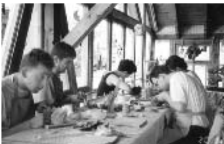
Auch die Kreativangebote während der Symposien fanden großen Zuspruch.

Die Unterschiedlichkeit der Fachrichtungen der Kollegiaten ergab eine stimulierende Arbeitsatmosphäre. Geförderte Kollegiaten waren neben Biologen, Pharmakologen und Biochemikern zum Beispiel auch