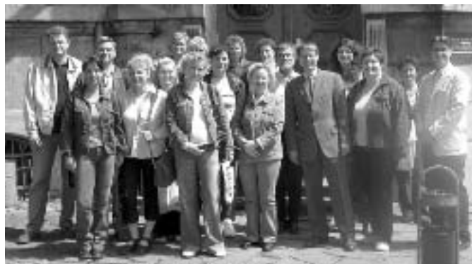
Teilnehmer des Laborpraktikums