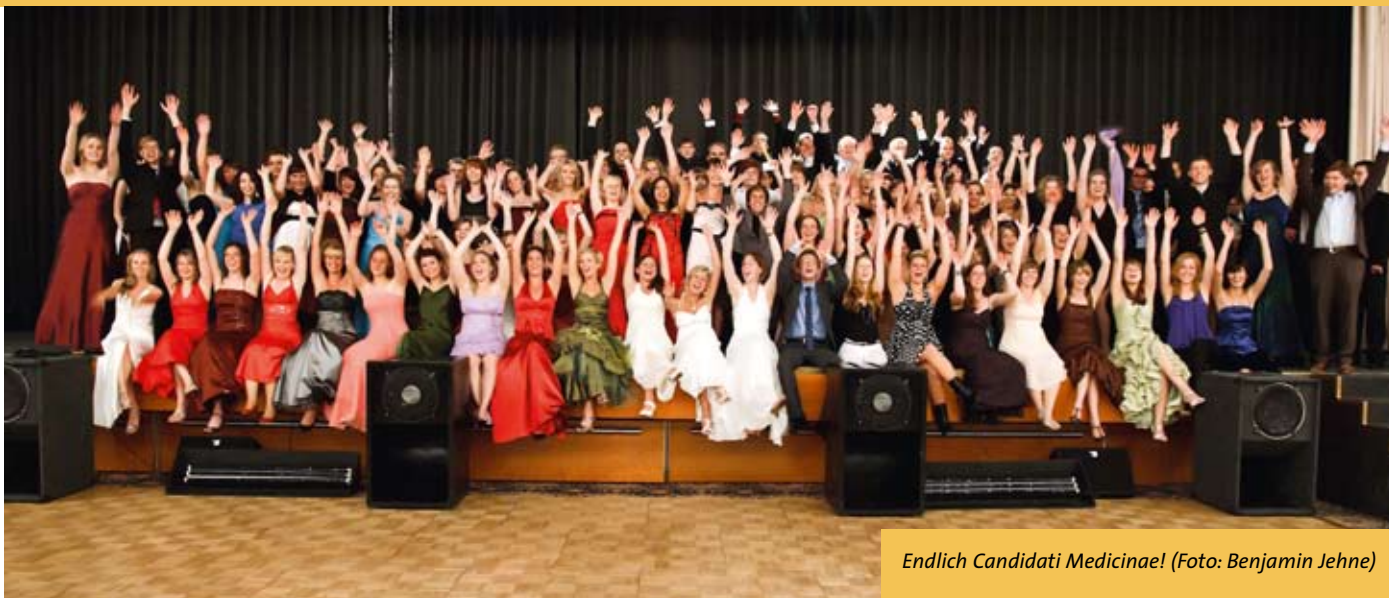
Endlich Candidati Medicinae!

Am 12. Juni 2010 fand er endlich statt, unser Physikumsball. Wir, Matrikel 2007, hatten zum Tanz ins Magdeburger Maritim Hotel geladen. Dieser Einladung waren immerhin 412 Gäste gefolgt, zu großen Teilen Kommilitoninnen und Kommilitonen, die nach strapaziösen vier oder auch mehr Semestern das Bezwingen der Vorklinik mit ihren Familien und Freunden feiern wollten. Von Seiten der Dozenten waren leider weit weniger als erhofft anwesend, obwohl wir mit einiger Vorlaufzeit persönlich Einladungen an die Leiter und Mitarbeiter aller Institute der Vorklinik verteilt hatten. Für diese, wenn auch geringe, Präsenz möchten wir uns aber an dieser Stelle nochmal ganz besonders bedanken!