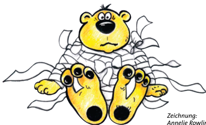
Zeichnung: Annelie Rowlin

Ihren Standort hatte die Teddyklinik neben dem Studentenclub „Kiste“ in einer kleinen „Zeltstadt“ mit Wartezimmer, Anmeldung, Untersuchungszimmer, Röntgenraum und einer Apotheke, also wie in einer „richtigen“ Arztpraxis. Anliegen ist es, Mädchen und Jungen einen Arztbesuch oder Klinikaufenthalt auf spielerische Art und Weise näher zu bringen. Die Vier- bis Sechsjährigen kön-