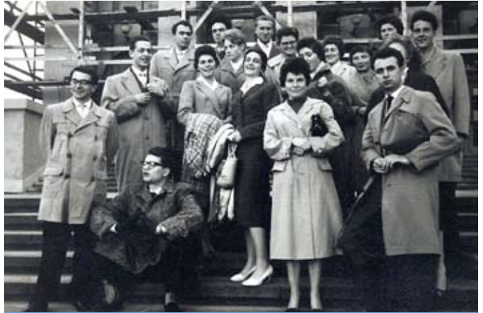
1959: Vor dem Theater in Dessau nach einer Aufführung der Oper „Nabucco“.

Internationales Graduiertenkolleg leistet hervorragende Arbeit