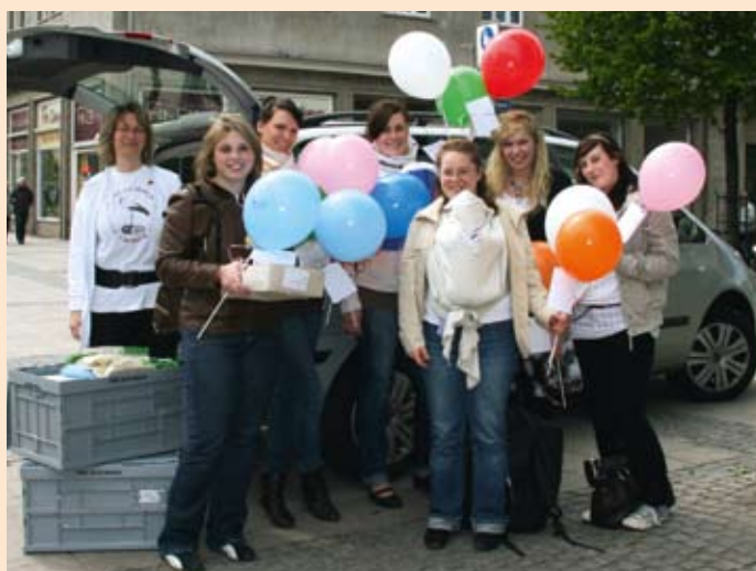
Hebammenaktionstag in Magdeburg

Aktionstag der Hebammen war ein großer Erfolg