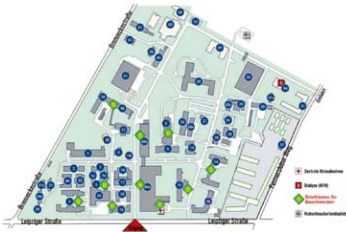
Standorte (grün) der Briefkästen auf dem Klinikumsgelände