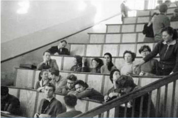
1958: Vorlesung im Zentralen Hörsaal