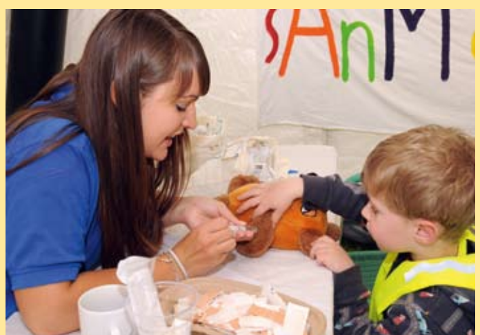
Teddyklinik 2010